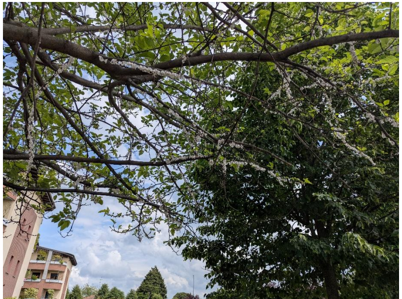
Figura 2: esemplari di Morus sp. con un grado di infestazione da Takahashia japonica tale da rendere inefficaci eventuali interventi di potatura.