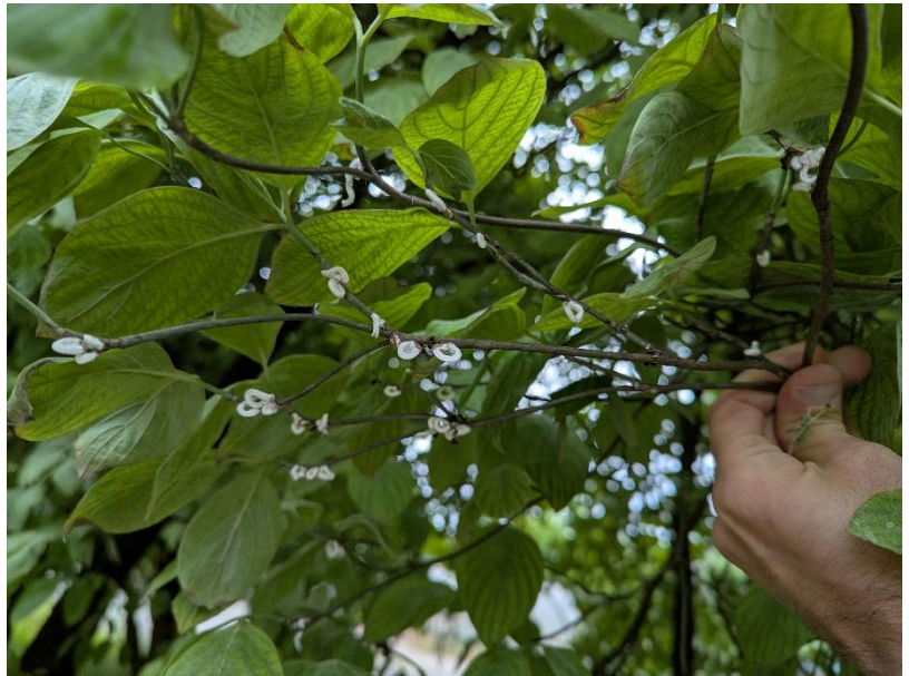
Figura 1: esemplare di Cornus florida con pochi rami infestati da Takahashia japonica per il quale un eventuale intervento di potatura nelle prime fasi dell'infestazione potrebbe risultare efficace.