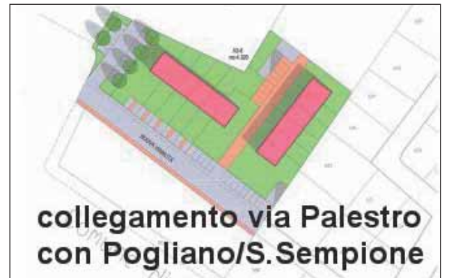
collegamento via Palestro con Pogliano/S. Sempione

Il Programma Integrato di Intervento su Barbaiana trae origine e spunto da complesse e approfondite analisi di fondo ma, in sintesi, punta a stabilire un primo semplice concetto: la tutela dei centri sto-